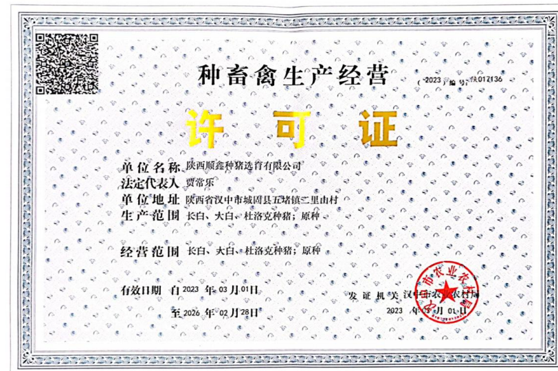
长白 大白 杜洛克原种