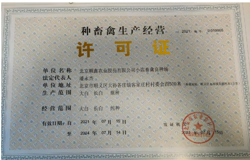
大白 长白 原种